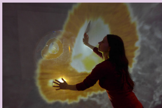
Métamorphose - Installation interactive visuelle et sonore - © Scenocosme

Une installation interactive, visuelle et sonore s'ajoute aux explorations artistiques de cette exposition collective. Métamorphose, créé par le couple d'artistes Scenocosme Grégory LASSERE et Anaïs MET DEN ANCKT , invite le visiteur à toucher et explorer la profondeur du voile semi-transparent qui compose le dispositif. Telle une peau symbolique, il se déforme au toucher pour reprendre ensuite sa rigidité.